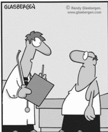
"What fits your busy schedule better, exercising one hour a day or being dead 24 hours a day?"

Read the text below and answer the following question based on it.