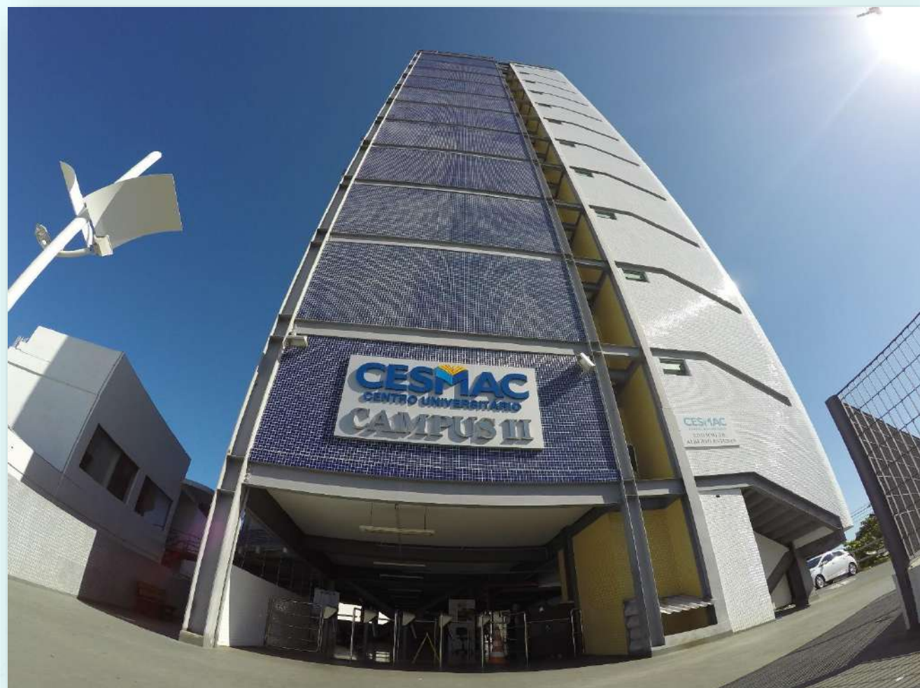
Centro Universitário Cesmac/Maceió – Campus II