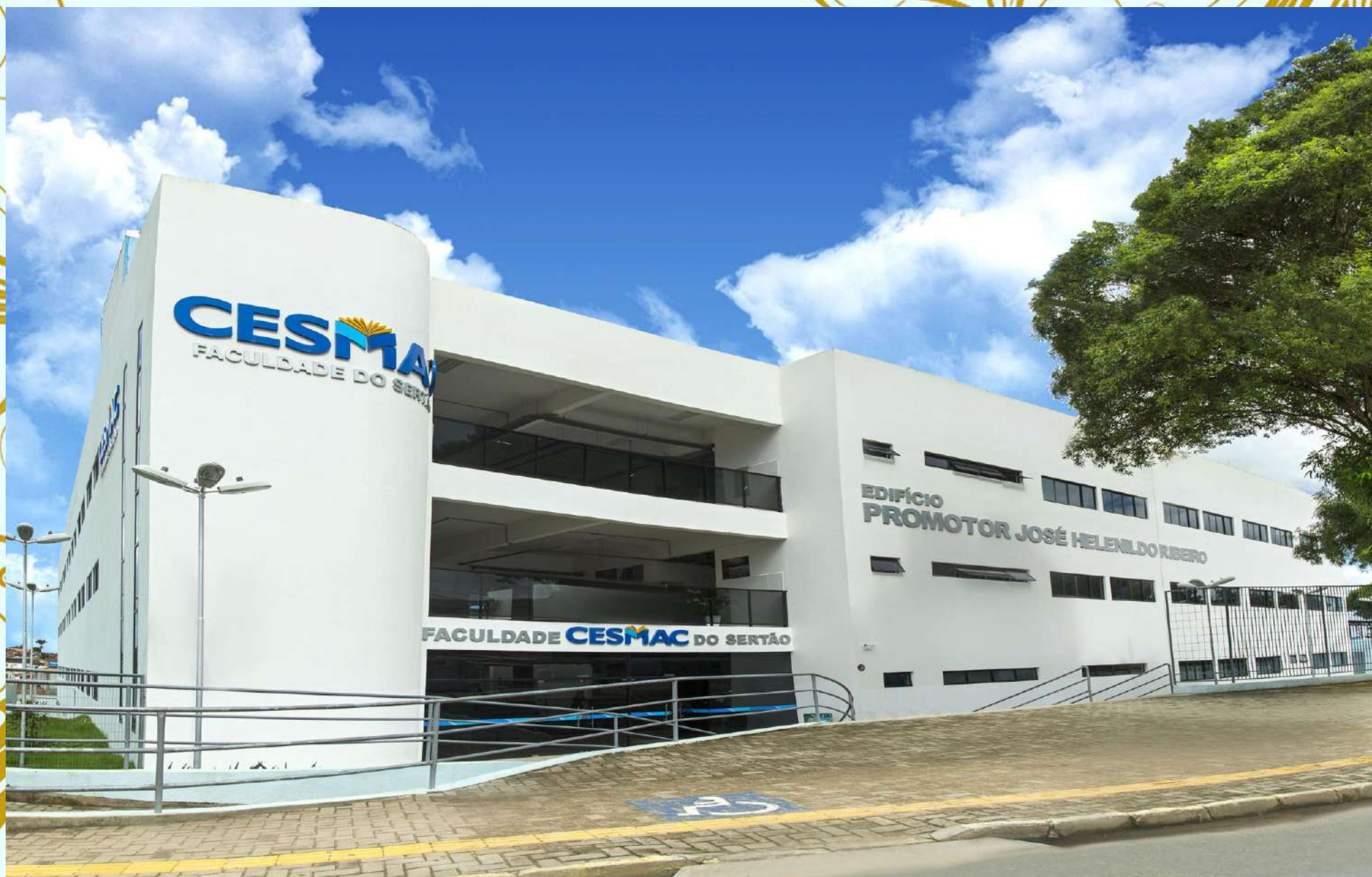
Faculdade Cesmac do Sertão – Palmeira dos Índios