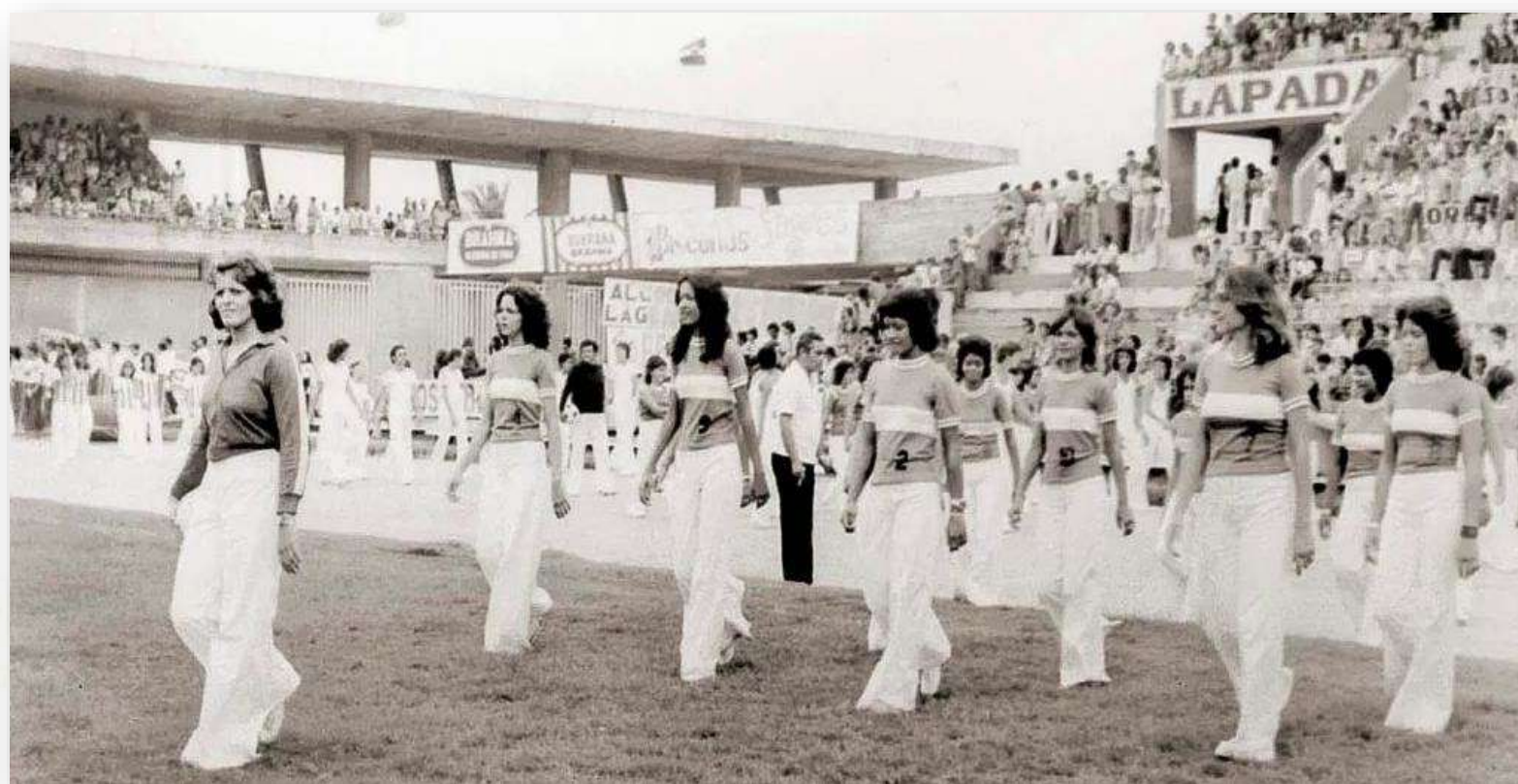
Colégio Guido desfilando no Trapichão, em 1974.

Em 1944, inicia-se o curso noturno masculino, uma iniciativa pioneira e em 1947, a turma noturna feminina também começou a funcionar, onde as turmas mistas vieram a acontecer alguns anos depois.