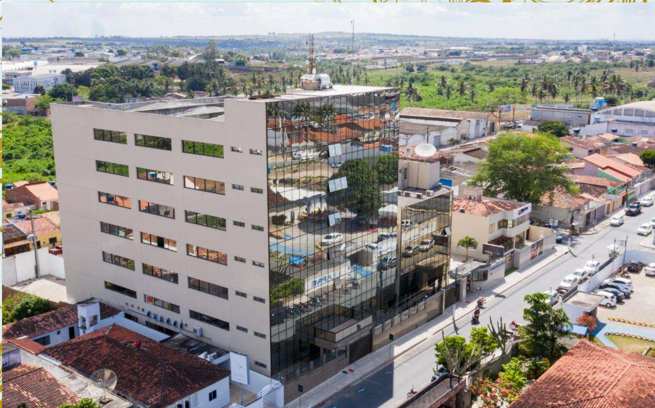
Faculdade Cesmac do Agreste – Arapiraca