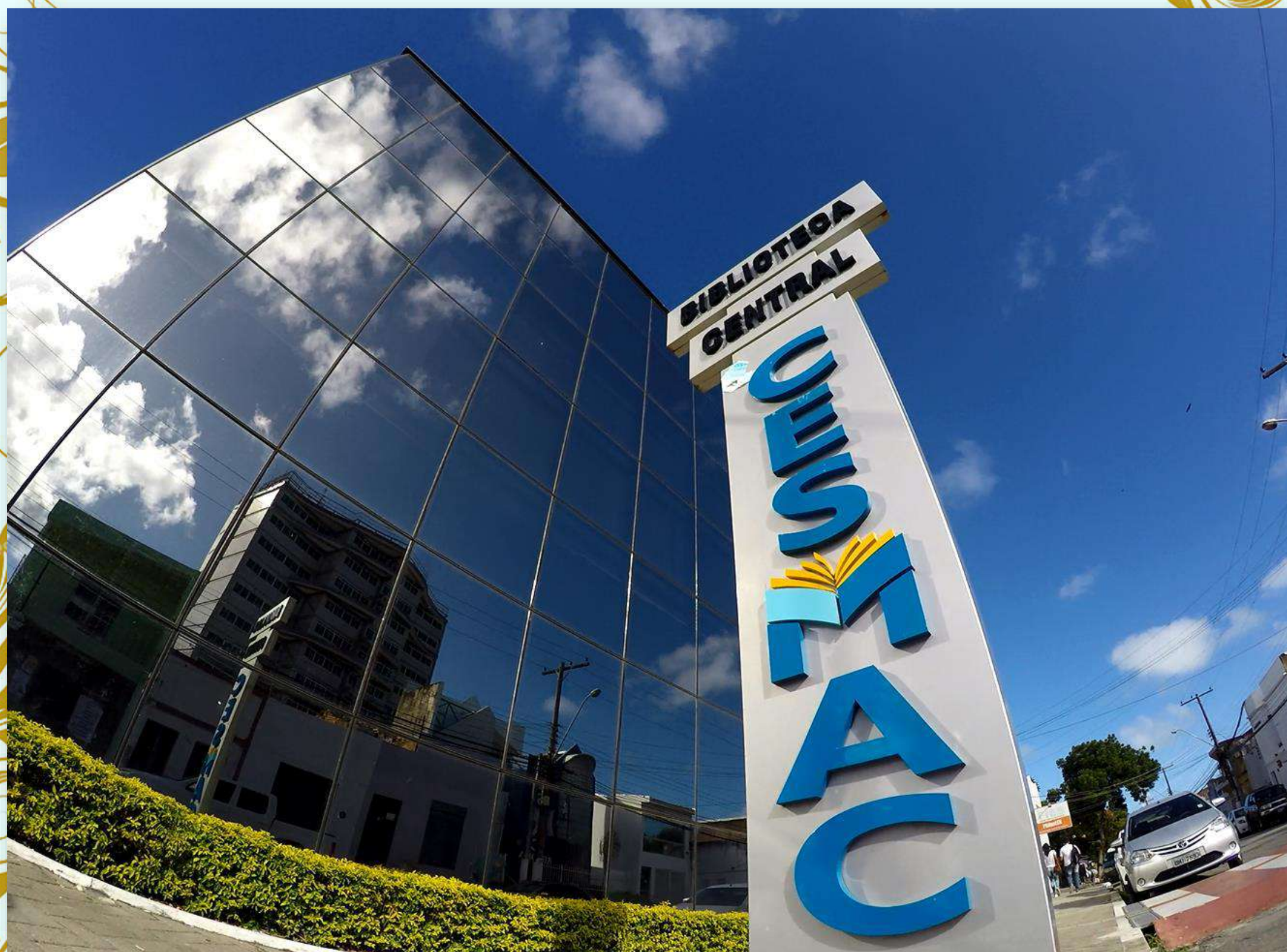
Centro Universitário Cesmac – Biblioteca Central