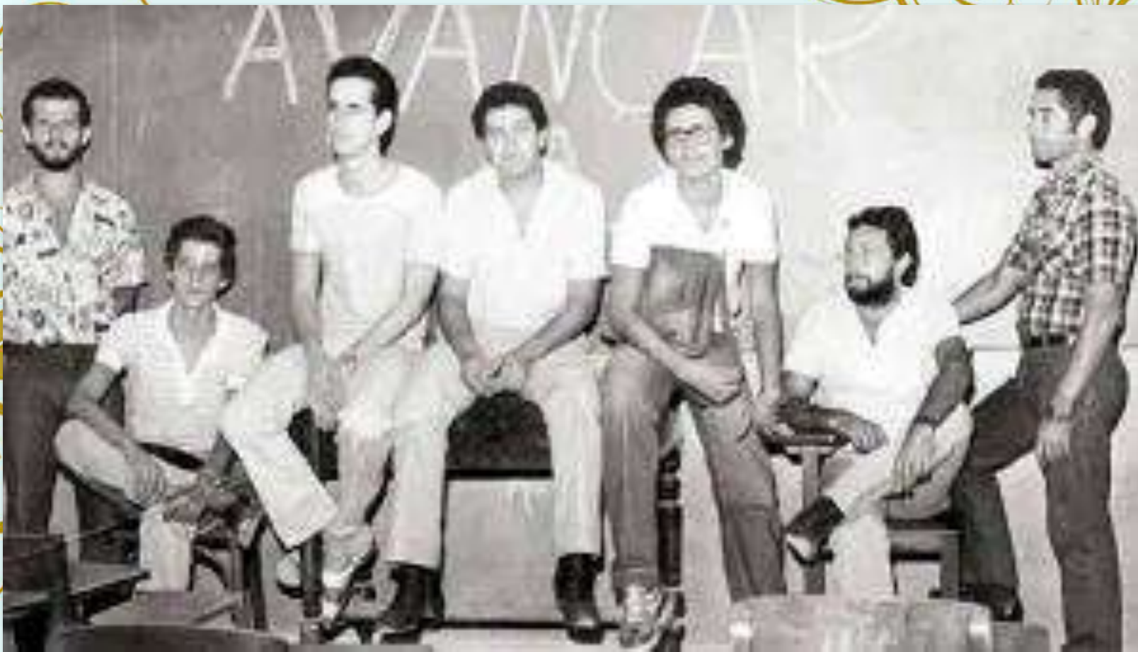
DCE do Cesmac em meados dos anos 80.