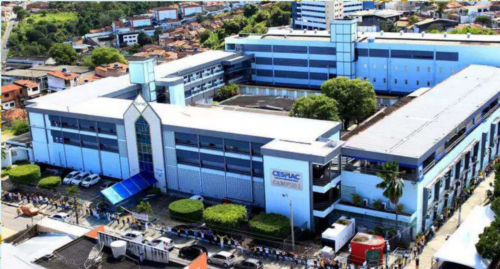
Centro Universitário Cesmac/Maceió – Campus 1