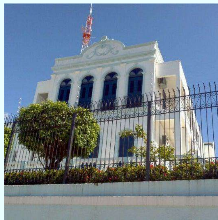
Centro Universitário Cesmac/Maceió – Campus 4