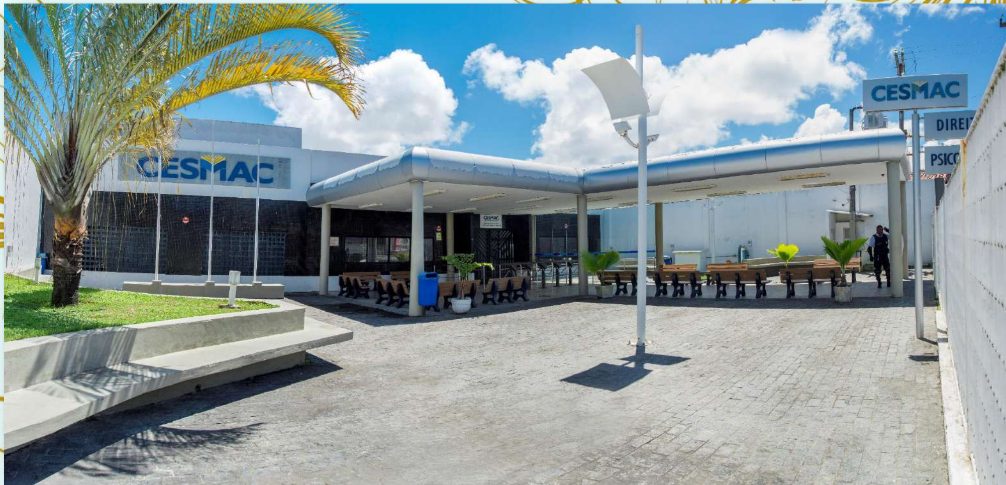
Centro Universitário Cesmac/Maceió – Campus 3